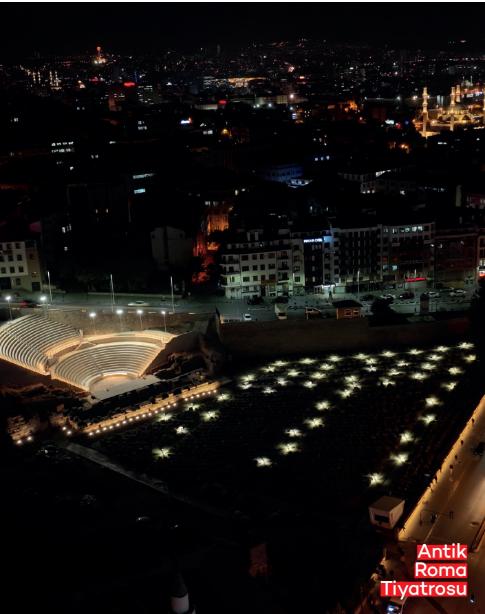
Antik Roma Tiyatrosu

Ankara Büyükşehir Belediyesi (ABB), kentin alt katmanlarına inerek iki bin yıllık Roma Dönemi'ni gün yüzüne çıkarıyor.